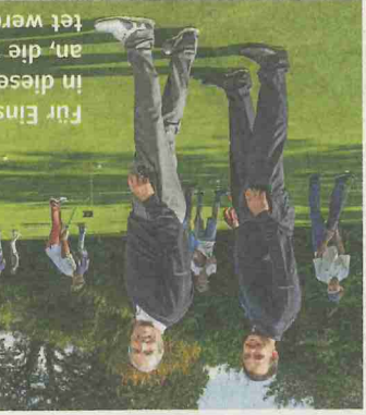
Für Einsteiger bieten die Golf-Clubs auch in dieser Saison wieder Schnupperkurse an, die von erfahrenen Trainern begleitet werden.

Weitere Schnupperkurse werden am 5., 12. und 26. Mai sowie 16. und 30. Juni angeboten, immer von 11 bis 13 Uhr. Neu in diesem Jahr: Es gibt erstmals zwei Platzreifekurse mit festen Startterminen, die demnächst im Club-Sekretariat erträgt bzw. auf der Homepage gc-sachsenwald.de nachgelesen werden können. Im Frühsommer soll es losge-